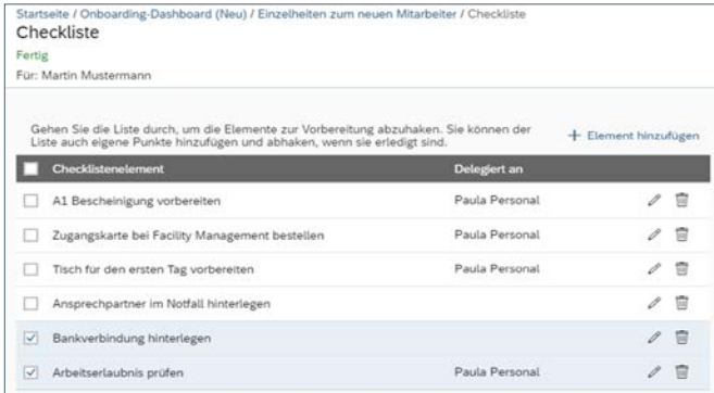
Abb.: Checkliste für Führungskräfte

Auch Offboarding ist Teil der Employee Experience und bedarf besonderer Aufmerksamkeit. Neben dem Wissenstransfer, der beim Weggang eines Beschäftigten frühzeitig sichergestellt sein muss, ist auch der Aspekt der Arbeitgebermarke und Reputation zu nennen. Darüber hinaus können auch interne Versetzungen oder Neubesetzungen durch das Crossboarding zielgerichtet unterstützt werden. Diesen Aspekt beherrscht SAP SuccessFactors Onboarding ebenfalls.