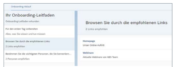
Abb.: Onboarding-Ablauf für neue Beschäftigte

Dank End-to-End-Digitalisierung wird mit der Paketlösung Onboarding von SAP SuccessFactors der gesamte Prozess mobilfähig abgebildet. Wichtige Formalitäten, die beim Einstellungsprozess abgehandelt werden, sind per E-Signatur-Funktion möglich. Formulare und Dokumente sind für mobile Geräte optimiert. Beschäftigte können so elektronisch unterzeichnen. Zusätzlich ist es möglich, die Employee Experience durch Chatbots mit künstlicher Intelligenz nutzerfreundlich zu gestalten.