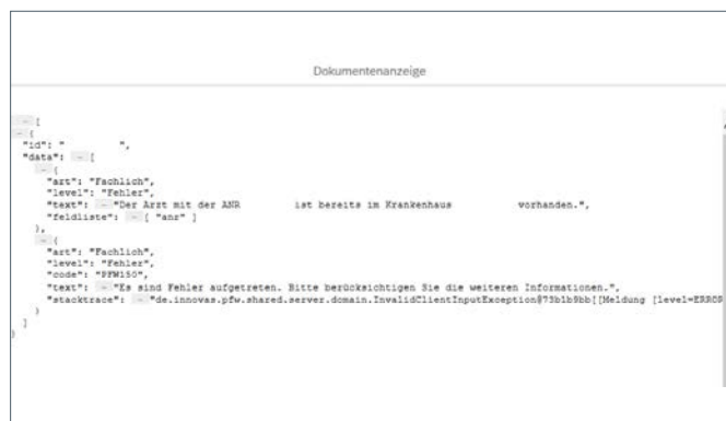
Abb.: Meldeprotokoll der Datenübertragung

Mit unserer Lösung ABS Team KHANRmatch stellen wir eine kompakte Erfassungsmaske zur Verfügung, die beispielsweise im Rahmen der Einstellungsmaßnahme genutzt werden kann. Erfasst werden: