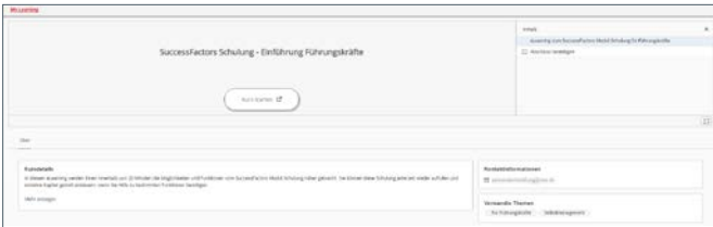
Abb.: Ansicht SAP SuccessFactors Learning Management

Regelmäßige Zertifizierungen, Pflichtschulungen und Wissenserweiterung: Die Szenarien, warum die Aus- und Weiterbildung in medizinischen Einrichtungen eine ganz besonders wichtige Rolle spielt, sind vielfältig. Unsere Paketlösung Healthcare Learning liefert Mitarbeitern, Führungskräften und Schulungsadministratoren umfangreiche funktionale Bausteine für eine moderne digitale Lernumgebung. Dazu gehört die Bereitstellung der Lernplattform, aber auch die Abbildung des vollständigen Administrationsprozesses zur Beantragung und Genehmigung interner wie auch externer Schulungen ( LMSHC/LMSETR ). Unsere Lösung LMSMonitor dient der Überwachung und Überprüfung notwendiger Pflichtqualifikation, bspw. von Pflegekräften.