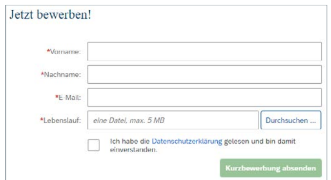
Abb.: Expressbewerbung (ohne Nutzerkonto) in SAP SuccessFactors Recruiting