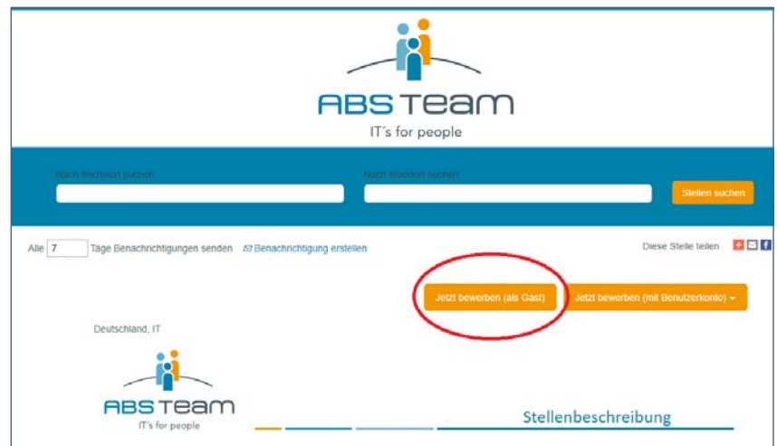
Button für Schnellbewerbung mit ABS Team Apply in Minutes im Design des SAP SuccessFactors Recruiting Career Site Builders